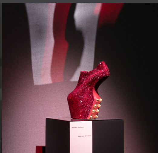
Выставка дизайнерской обуви «Генезис». 2016 год