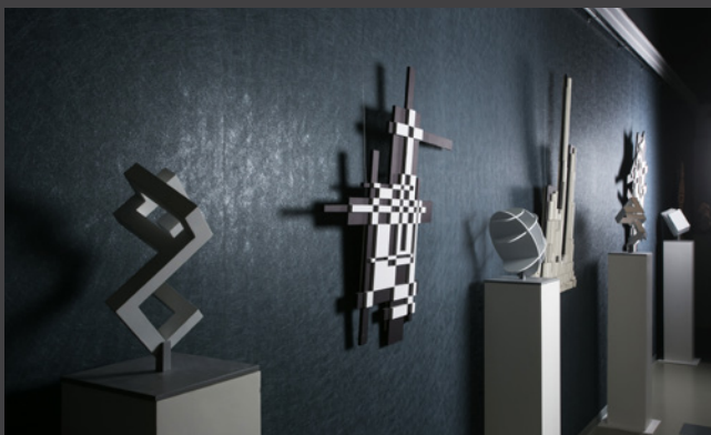
Выставка работ Якова Чернихова «Коды геометрии». 2015 год