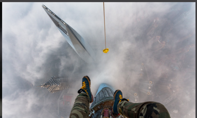
Выставка фотографий «На высоте». 2016 год