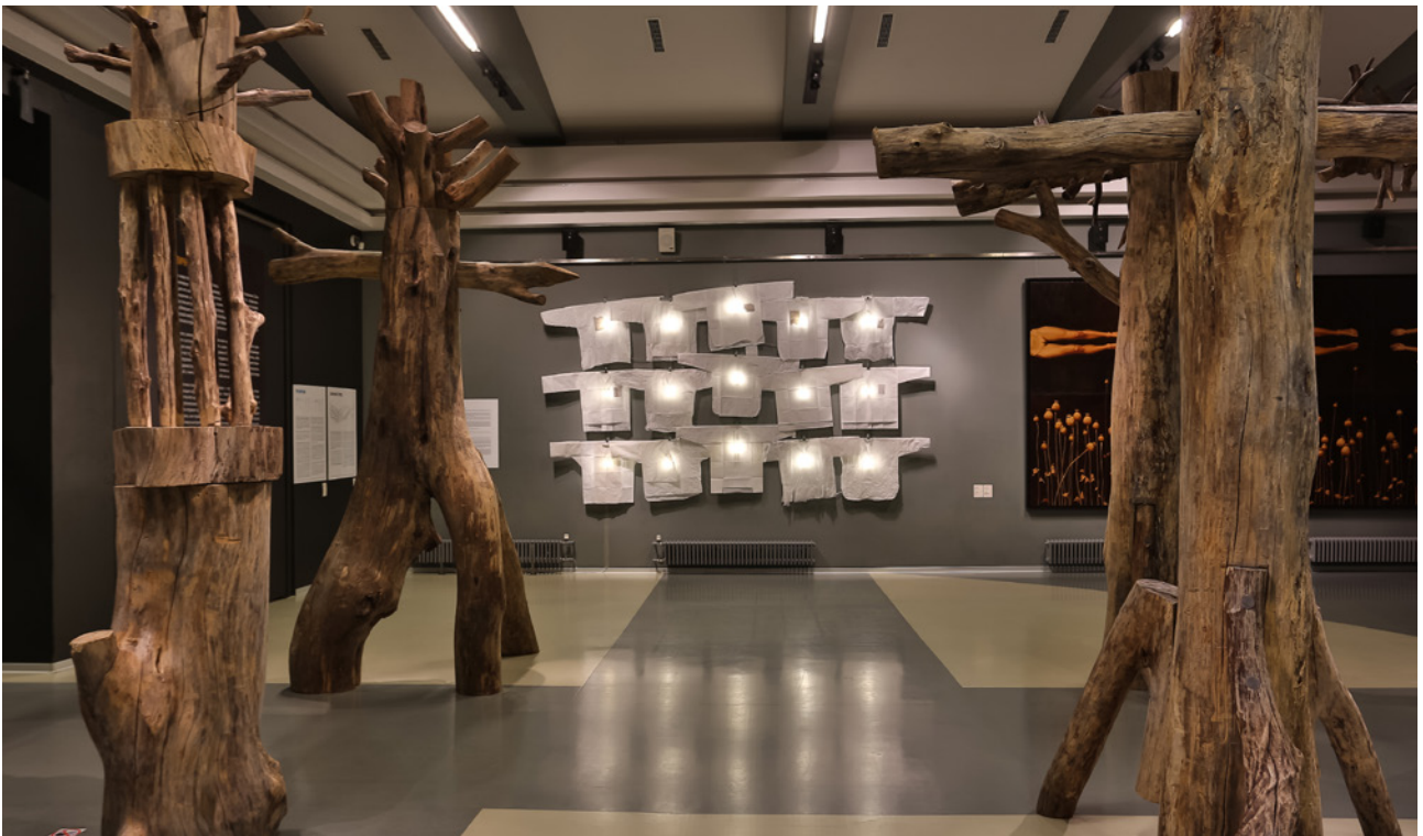
Николай Полисский – Границы империи