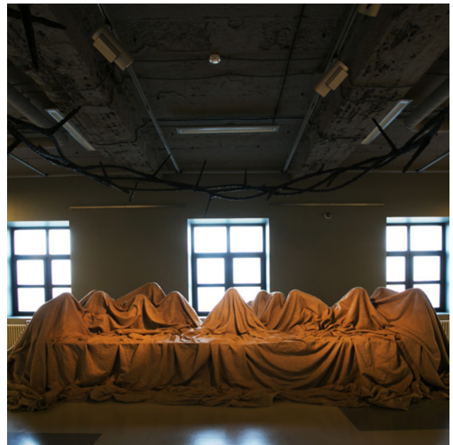
Павел Гришин – Тайная вечеря