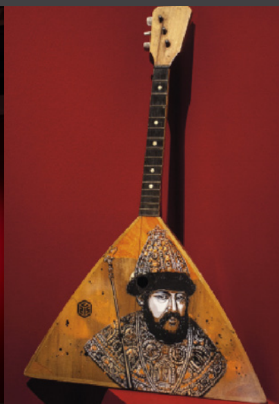
Выставка стрит-артиста С215 «Паноптикон». 2016 – 2017 гг.