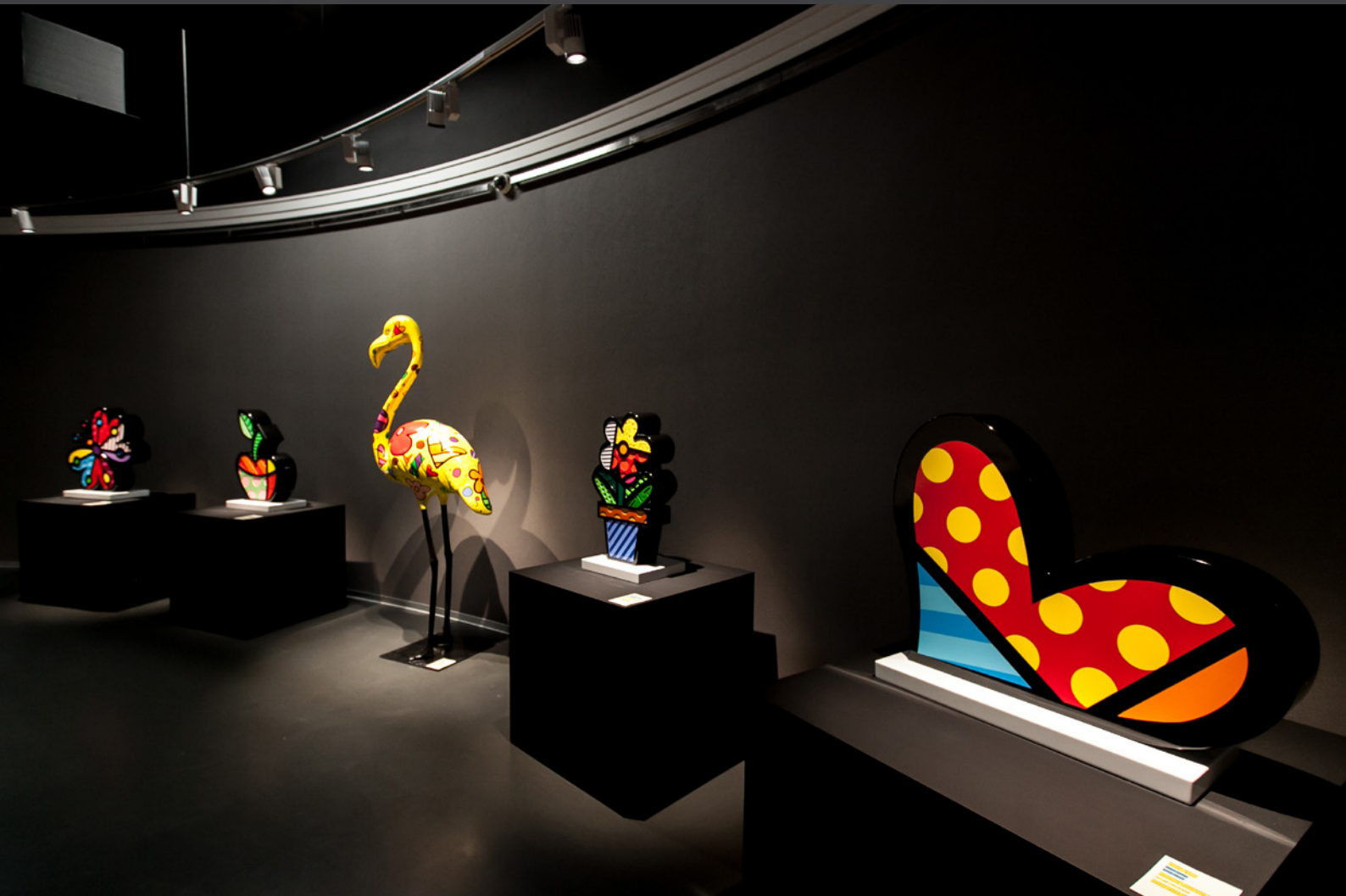
Выставка «Ромеро Бритто: формула успеха». 2015 год