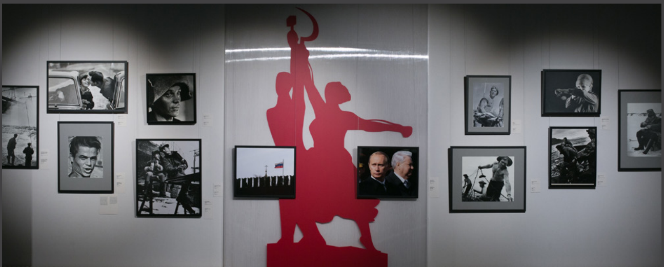
Выставка фотографий Юрия Абрамочкина «История в мгновениях: наше время». 2016 год